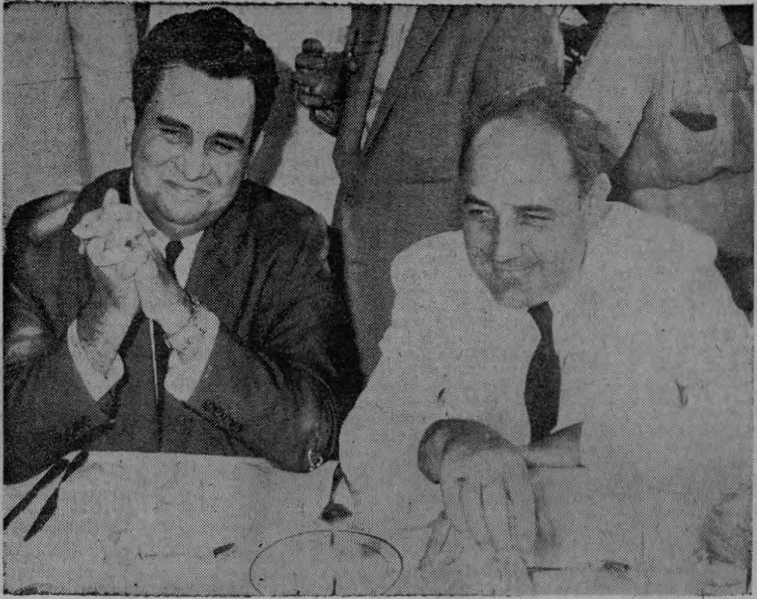
Los Presidentes de Nicaragua, Ing. Somoza Debayle, y de Costa Rica, Lic. Echandi Jiménez, sonríen momentos después de haber sido colocada por ellos en Peñas Blancas la primera piedra del edificio aduanero que será común para los dos países