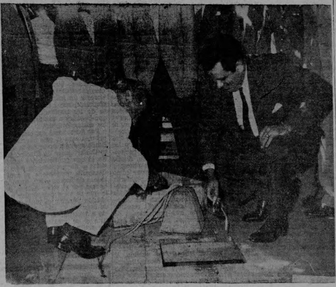
Histórico momento en que los Presidentes de Nicaragua y Costa Rica, Ing. Somoza Debayle y Lic. Echandi Jiménez, se disponían a colocar en Peñas Blancas, a las 11 horas en punto del sábado pasado, la primera piedra, que puede observarse en a gráfica, del edificio común aduanero.

después de la ceremonia de colocación de la primera piedra del edificio común de Aduanas de Nicaragua y Costa Rica en Peñas Blancas, en que tomaron parte los Jefes de Estado de Nicaragua y Costa Rica. Y agregó el Ing. Somoza: —Mi Gobierno ha podido probar plenamente que el cargo que se le ha hecho no tiene el menor fundamento. Es propósito firme del Gobierno que presido mantenerse absolutamente alejado de los conflictos internos de los países vecinos y amigos. Estaremos prontos a participar, sin embargo, en movimientos que tendan a lograr una adecuada integración económica de las naciones centroamericanas, en planes culturales que nos acerquen cada vez más a los centroamericanos; pero no estamos dispuestos en ningún momento a intervenir en los problemas políticos de ninguno de los restantes países de Centro América, porque a sus respectivos pueblos a quienes corresponde exclusivamente la resolución de sus propios problemas domésticos.