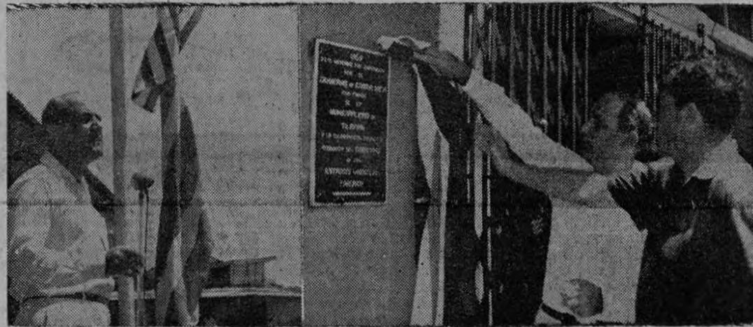
La gráfica de Roa recoge el momento en que el Presidente de la República, Lic. Echandi Jiménez y el Embajador de los Estados Unidos señor Whiting Willauer descubren la placa conmemorativa colocada en la pared frontal del moderno mercado de Tilarán inaugurado ayer oficialmente; y en otra, al señor Presidente Echandi Jiménez cuando pronunciaba su discurso